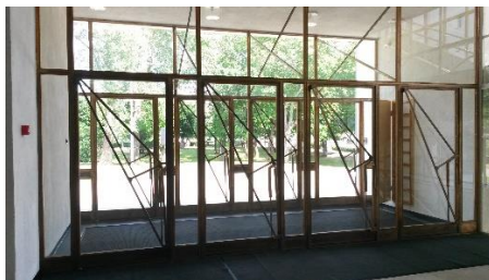
Ulko-ovet eivät juuri aaltoile.

Odotteluaikaa jäi puolen tuntia, joten kävelin ympäröivässä puistossa, ja kirjastonkin ehdin kiertää kolmesti. Hyvissä ajoin asetuin ulko-ovelle yhden hengen jonoon, etten vain jäisi pois ryhmästä. Ihmeen hiljaiselta tienoo vaikutti, vain muutama ”alkuasukas” kierteli oven tuntumassa. Tasan klo 11 alkoi sisällä näkyä liikettä, ja ilmeinen vahtimestarihenkilö avasi oven. Hän viittilöi minut sisään, kun aikani solkkasin ”ekskursio, ekskursio”. Katselin ympärilleni aulassa, kunnes näin ylätasanteella jonkinlaisen lipunmyyntipisteen. Kohteliaasti tervehdittyäni tulkutin jälleen tuota ainoa muistamaani sanaa, johon vastattiin vuolaalla venäjänkielisellä puhetulvalla. Kun yhteistä kieltä ei yrityksistä huolimatta löytynyt, totesin että pelin henki on että venäjällä on selvittävä... Ymmärsin, että kierros on opastettu vain venäjäksi (sen olin kyllä jo arvannut), ja kun sain virkailijan vakuuttuneeksi, että asia on harashoo (Da, da!), hän myi minulle pääsylipun. Se kourassani sitten ihmettelin, mihin seuraavaksi – mitään opasteita en nähnyt – joten lähdin tulosuuntaan ja pujahdin avoimesta ovesta muutaman muun ihmisen kanssa valoisaan, kauniin aaltokattoiseen musiikkisaliin.