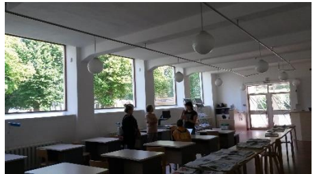
Lehtisali kesäpäivän varjoissa.

Kierroksen päätteeksi kulttuurit kohtasivat: onnistuin käymään pienen alkeellisen keskustelun oppaan kanssa; keuhmaan kierrosta ja kirjastoa ja kertomaan mistä olen ja miksi tulin. Pakkohan se oli edes yrittää, ja katso: joskus kukkokin munii. Spasiba ja Da svidanija!