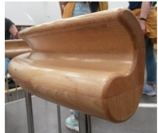
Aaltomainen kaide. Suunnittelun ja puusepäntaidon juhlaa!

Kiertelimme käytäviä, joiden varrella sijaitsee henkilökunnan työtiloja, ja valoisien porraskäytävien kautta laskeuduimme kellarikerroksen varastokirjastoon. Siellä säilytetään kirjojen lisäksi mm. Aallon alkuperäistä, kerroksittain avattavaa kirjaston pienoismallia, sekä lukituissa vitriineissä olevia vanhoja kirjoja. Villi veikkaukseni on, että nähtävillä oli venäläisten klassikkokirjailijoiden teosten ensipainoksia: Dostojevski, Tolstoi, Gogol, Gorki... Sumeilematta otin paikasta valokuvia, kun kukaan ei kieltänytään.