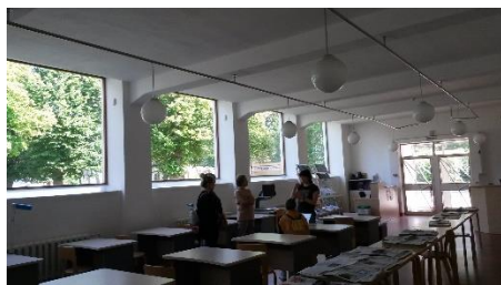
Lehtisali kesäpäivän varjoissa.

Kierroksen päätteeksi kulttuurit kohtasivat: onnistuin käymään pienen alkeellisen keskustelun oppaan kanssa; kehuun kierrosta ja kirjastoa ja kertomaan mistä olen ja miksi tulin. Pakkohan se oli edes yrittää, ja katso: joskus kukkokin munii. Spasiba ja Da svidanija!