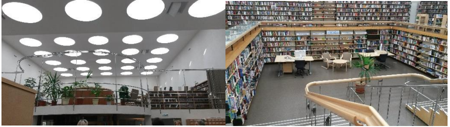
Valoaallot kirjojen yllä.