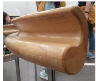
Aaltomainen kaide. Suunnittelun ja puusepäntaidon juhlaa!

Kiertelimme käytäviä, joiden varrella sijaitsee henkilökunnan työtiloja, ja valoisien porraskäytävien kautta laskeuduimme kellarikerroksen varastokirjastoon. Siellä säilytetään kirjojen lisäksi mm. Aallon alkuperäistä, kerroksittain avattavaa kirjaston